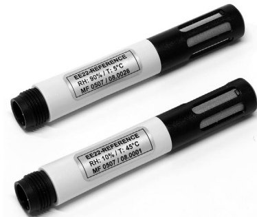
Referenzfühler / reference probes